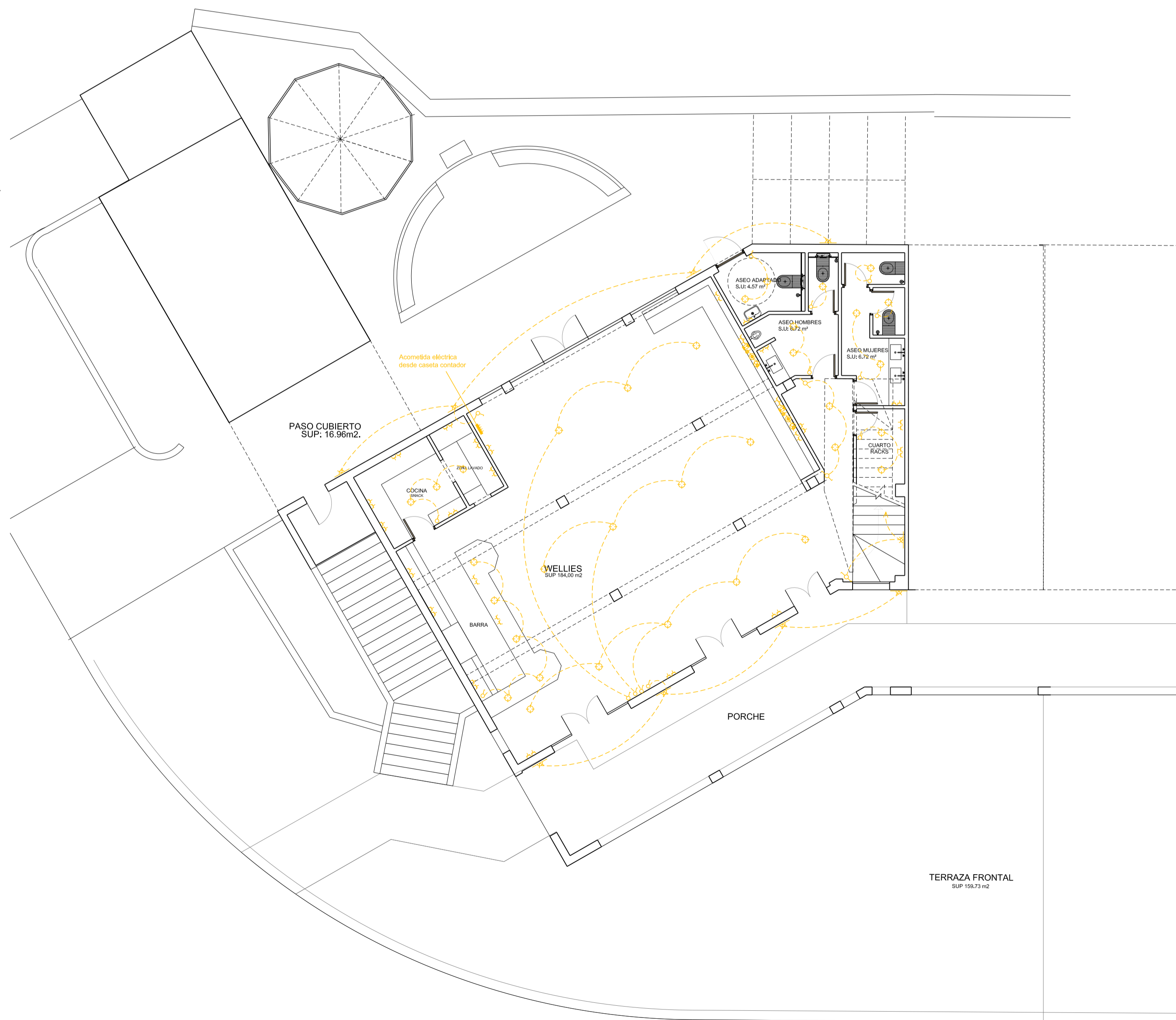
PLANTA BAJA - ELECTRICIDAD