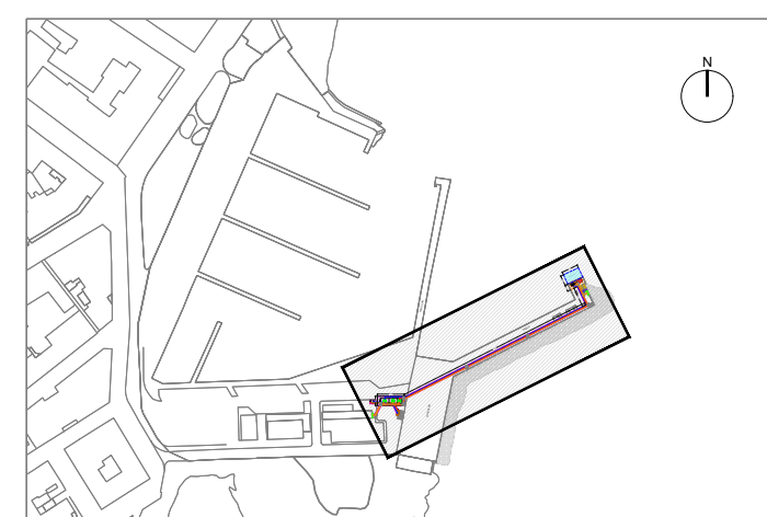
SITUACIÓN EN EL PUERTO E: 1/4000